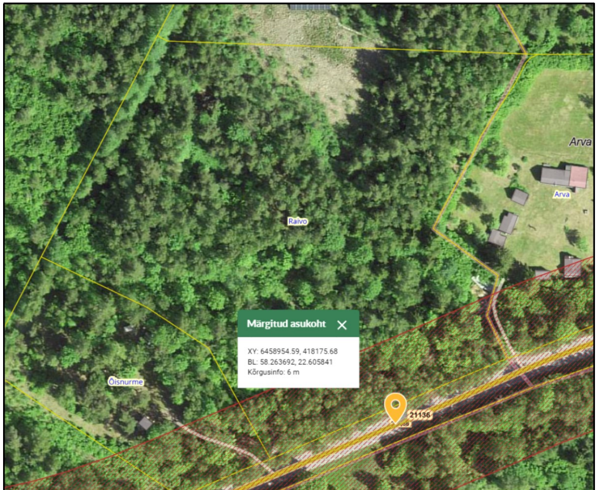
Joonis 1. Ristumiskoha asukoht tähistatud oranži tingmärgiga